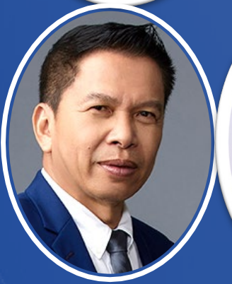
บรรเทิง ว่องกุศลกิจ

อธิบดีกรมการเปลี่ยนแปลงสภาพภูมิอากาศและ สิ่งแวดล้อม